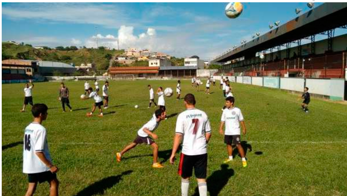
Treino do sub-15

Depois de um desempenho considerado excelente na Taça BH, quando a equipe de futebol de campo Sub-17 do Athletic mostrou bom futebol e perdeu por pouco do Botafogo (RJ) – vice-campeão brasileiro na categoria – e do